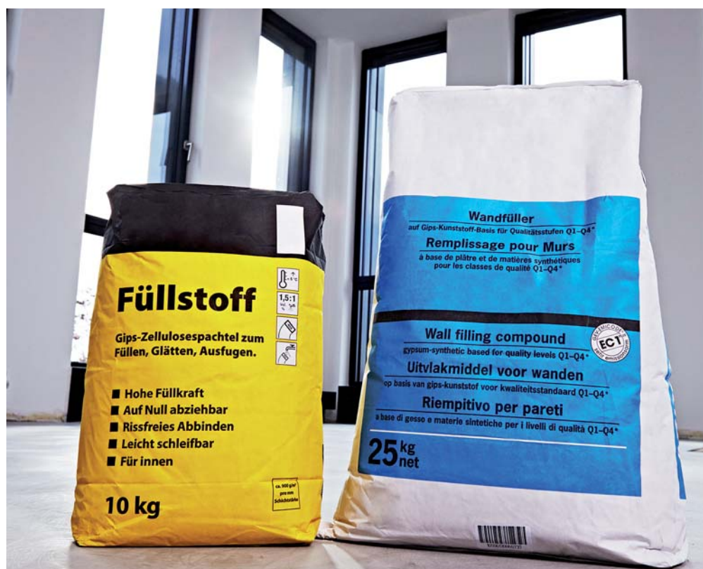
Ventilsäcke aus Papier überzeugen als kosteneffiziente Verpackung mit langer Lebensdauer.

Beim Baustoffhersteller Schönox gab es vor einigen Jahren die Überlegung, ob man auf die FFS-Abfülltechnik um-